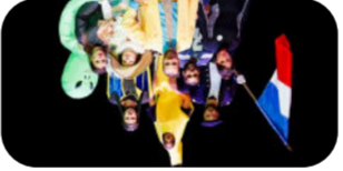
Collectif La Cabale